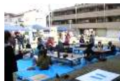
芝生広場で楽しいひととき