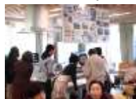
布川米の試食と販売