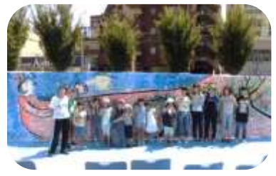
完成した絵を前に記念撮影