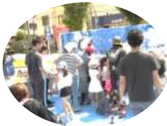
ライブペインティングスタート！