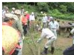
剪定ばさみの実習

現在、放置されたままになっている雑木林は、わずか50年前まで私たちの暮らしにとってかけがえのない大切な場所でした。日野市雑木林ボランティア講座は、昔のような明るく健全な雑木林を維持管理し次世代に引き継ぐことを目的に、市民と行政との協働で平成17年にスタートしました。12期（平成28年度）までの講座修了者は累計で269人になっています。この講座を通して専門的な知識や技術を習得した雑木林ボランティアを育成し、新しい緑の保護団体を設立したり、既存の緑の団体で活躍してもらおうと頑張っています。昨年5月に発足した「谷仲山緑地を守る会」もその成果のひとつで現在メンバー25名が活発に活動しています。