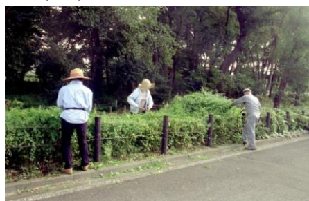
大木島自然公園での日野の自然を守る会の活動状況