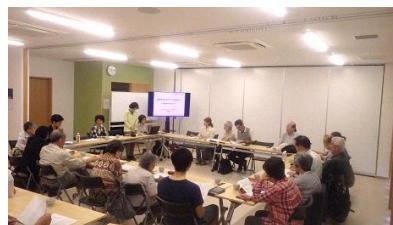
まちづくり勉強会第1回の様子