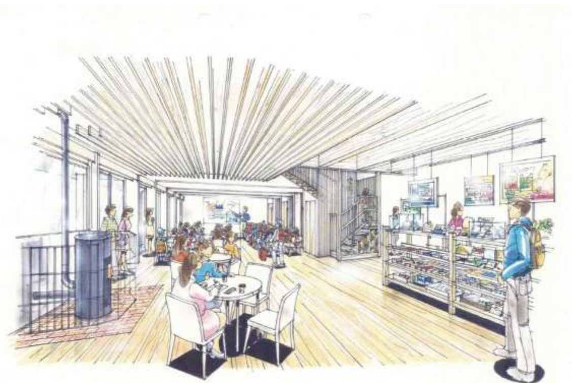
ビジターセンター・オープンスペース イメージ図