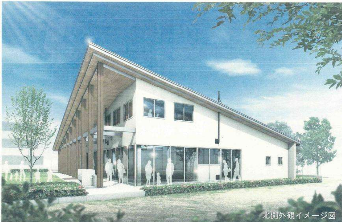
北側外観イメージ図