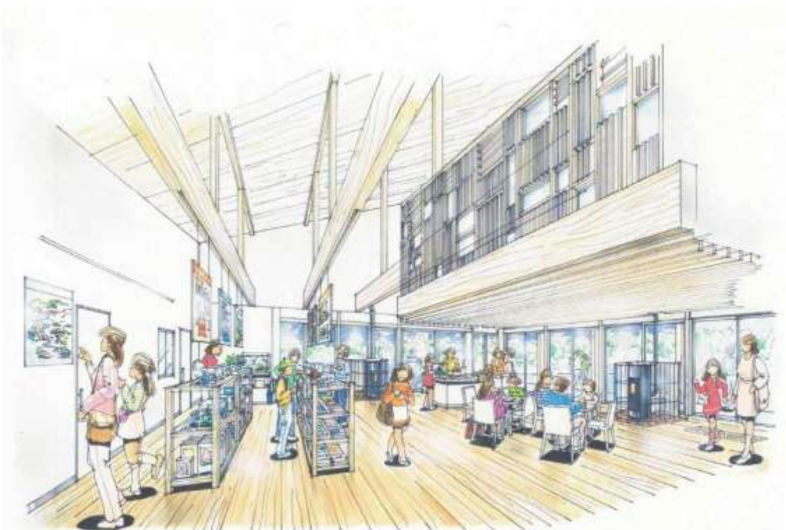
ビジターセンター・オープンスペース イメージ図